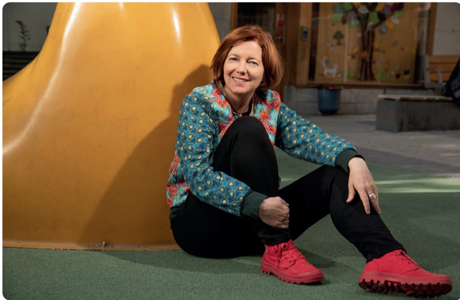
Malin Björk har suttit i EU-parlamentet i två mandatperioder.

– Det är den enda del i de nya lagförslagen som går ut på att öppna en dörr för människor på flykt, en säker väg. Det är jag stolt över att ha varit huvudansvarig för från parlamentets sida, säger Malin Björk.